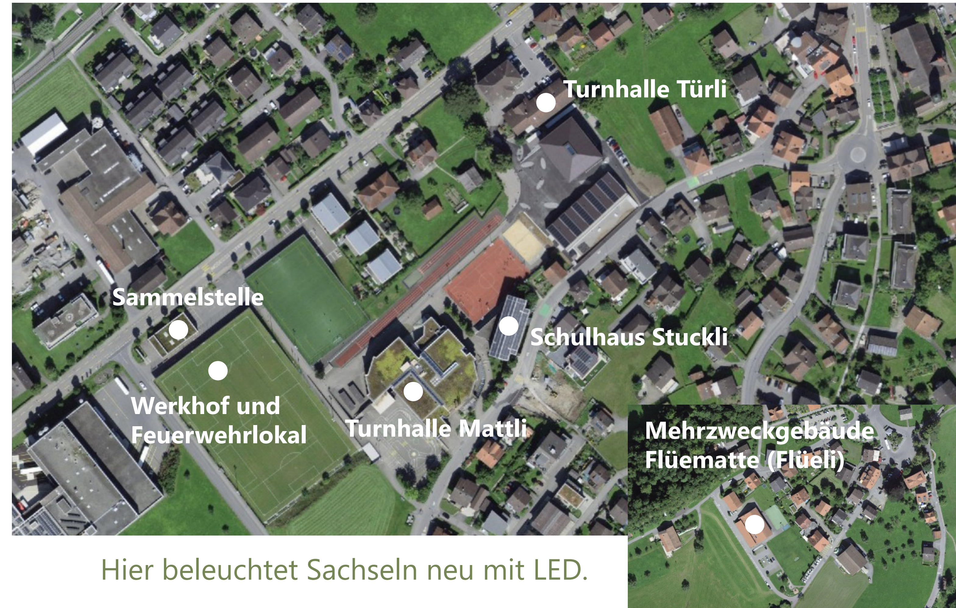
Hier beleuchtet Sachseln neu mit LED.